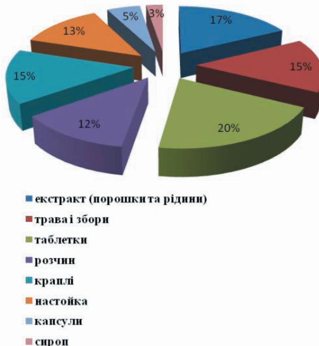
Рис. 1. Розподіл лікарських препаратів з використанням Hypericum perforatum L. за лікарською формою

Звіробій має фотосенсибілізуючі властивості – підвищує чутливість шкіри до ультрафіолетового проміння (наявність в ньому гіперіцину), що використовується при лікуванні вітиліго. У стоматології препарати з трави звіробією використовують для полоскання ротової порожнини і змазувань десен при гінгівітах і стоматитах, при неприємному запаху з ротової порожнини. У гінекологічній практиці настій трави використовують для спринцювань при запальних захворюваннях піхви, а звіробійну олію (у вигляді тампонів) – для лікування ерозії шийки матки [8]. У народній медицині, окрім усіх вищезазначених випадків, звіробій використовують при поліартриті, ішіасі, подагрі,