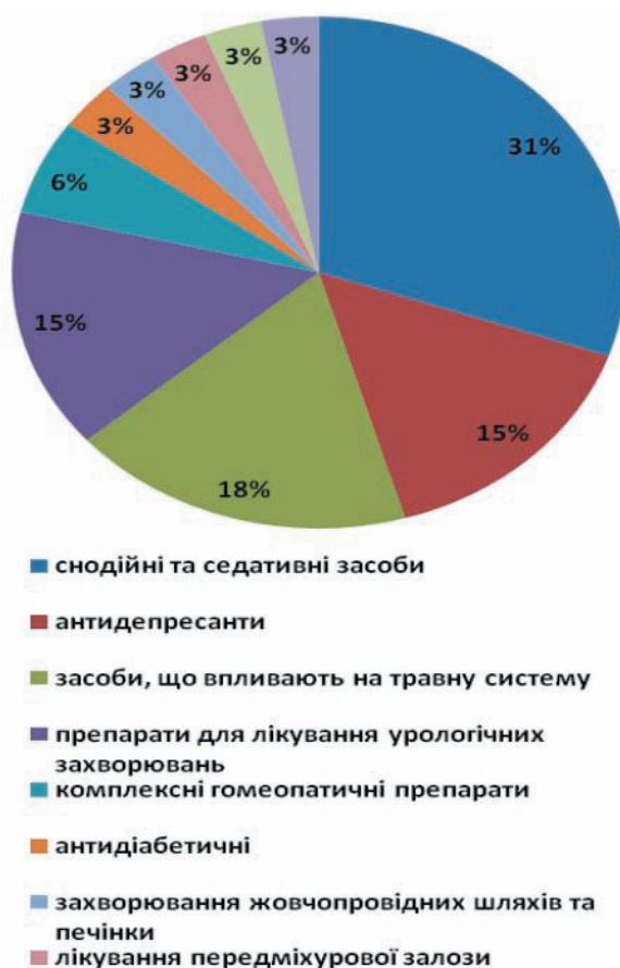
Рис. 4. Розподіл лікарських препаратів з вмістом Hypericum perforatum L. за фармакотерапевтичними групами

Серед препаратів іноземного виробництва лідируючі позиції займають лікарські засоби, вироблені в Німеччині.